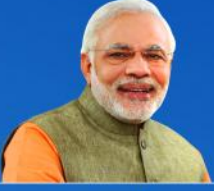
নরেন্দ্র মোদী প্রধান মন্ত্রী