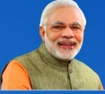
নৰেন্দ্ৰ মোডী প্ৰধানমন্ত্ৰী