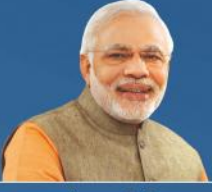
नरेन्द्र मोदी प्रधान मंत्री