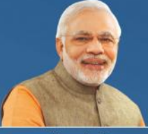
नरेंद्र मोदी पंतप्रधान